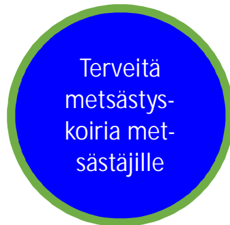
Kuva 1: SSK:n visio

SSK:n visio on "Terveitä metsästyskoiria metsästäjille". Se kuvaa SSK:n tavoitetta turvata monikäyttöiset metsästyskoirarodut sekä huolehtia metsästyskäytön edellyttämien terveysvaatimusten huomioiminen koirien jalostuksessa. Jäsenten ja kasvattajien tuella edistetään metsästyskoirien päätymistä metsästäjille tai metsästyskäyttöön. Suomalainen metsästyskulttuuri on vaalimisen arvoinen. SSK kantaa vastuuta tulevien sukupolven harrastusmahdollisuuksien jatkumisesta.